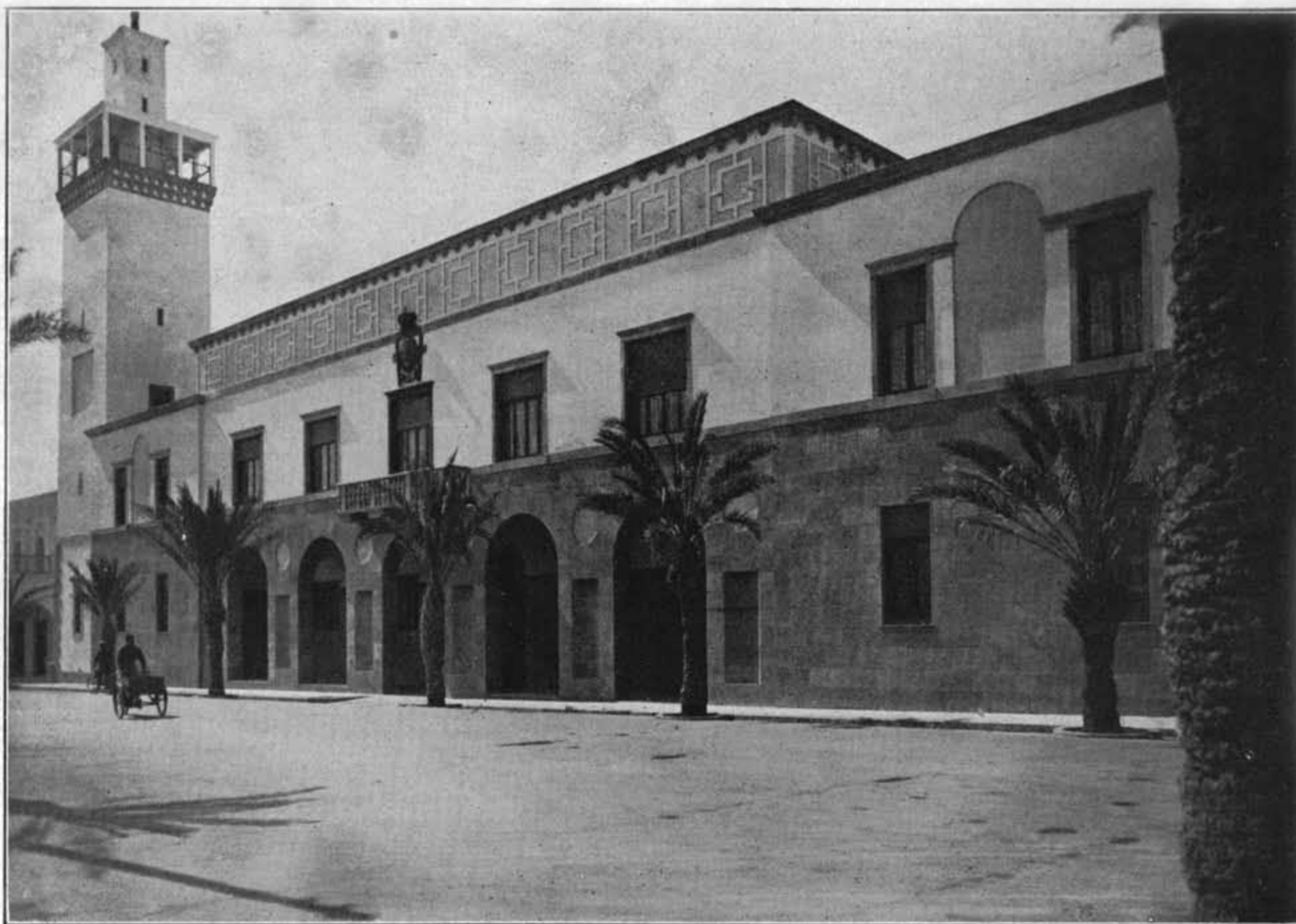
ARCH. OTTAVIO CABIATI E GUIDO FERRAZZA: RESIDENZA DEL GOVERNATORE DELLA CIRENAICA A BENGASI.