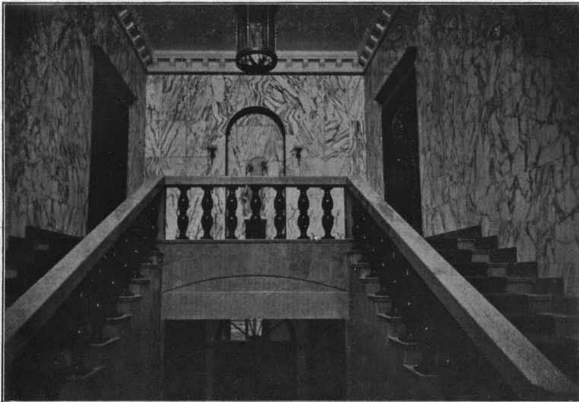
PORTICO (SOPRA). - SCALONE D'ONORE (SOTTO).

ARCH. O. CABIATI E G. FERRAZZA : RESIDENZA DEL GOVERNATORE DELLA CIRENAICA IN BENGASI.