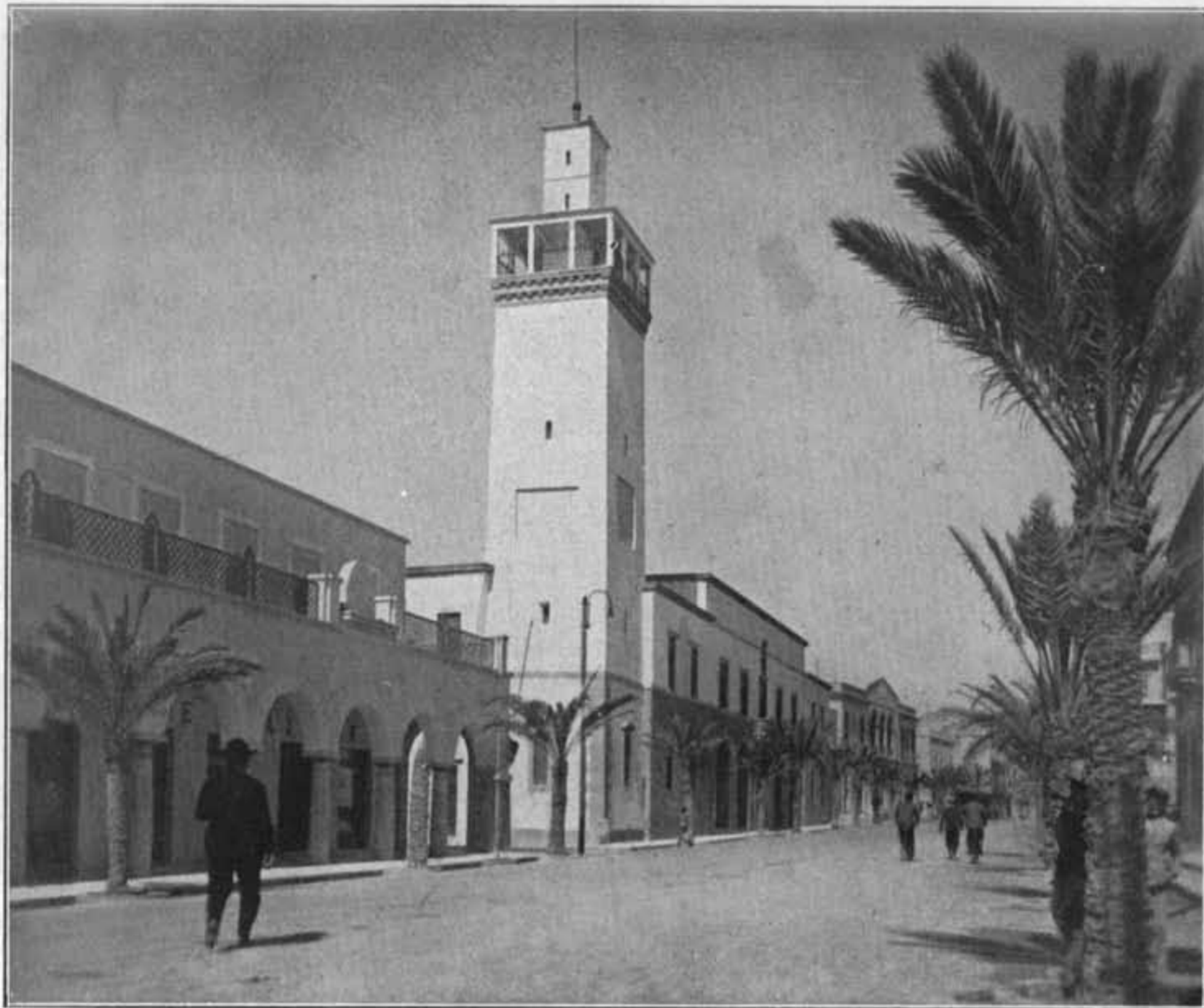
ARCH. O. CABIATI E G. FERRAZZA: RESIDENZA DEL GOVERNATORE DELLA CIRENAICA IN BENGASI. VEDUTA DI FIANCO.

fresca modernità. Particolare finezza e leggiadria sono in ogni dettaglio, nell'esilità di modanatura delle cornici di coronamento dell'edificio e nelle sagome delle mostre di finestra, nell'elemento terminale del torrione, nella lunga e sottile massa del piano attico, la cui fronte rabescata, con tenue disegno di greca a breve risalto sul fondo pieno, conferisce singolare armonia e serietà a tutta la fronte della costruzione. Peccato che dopo tanto tempo ancora non si sia trovato il modo di collocare in opera i bassorilievi previsti nei due riquadri del torrione.