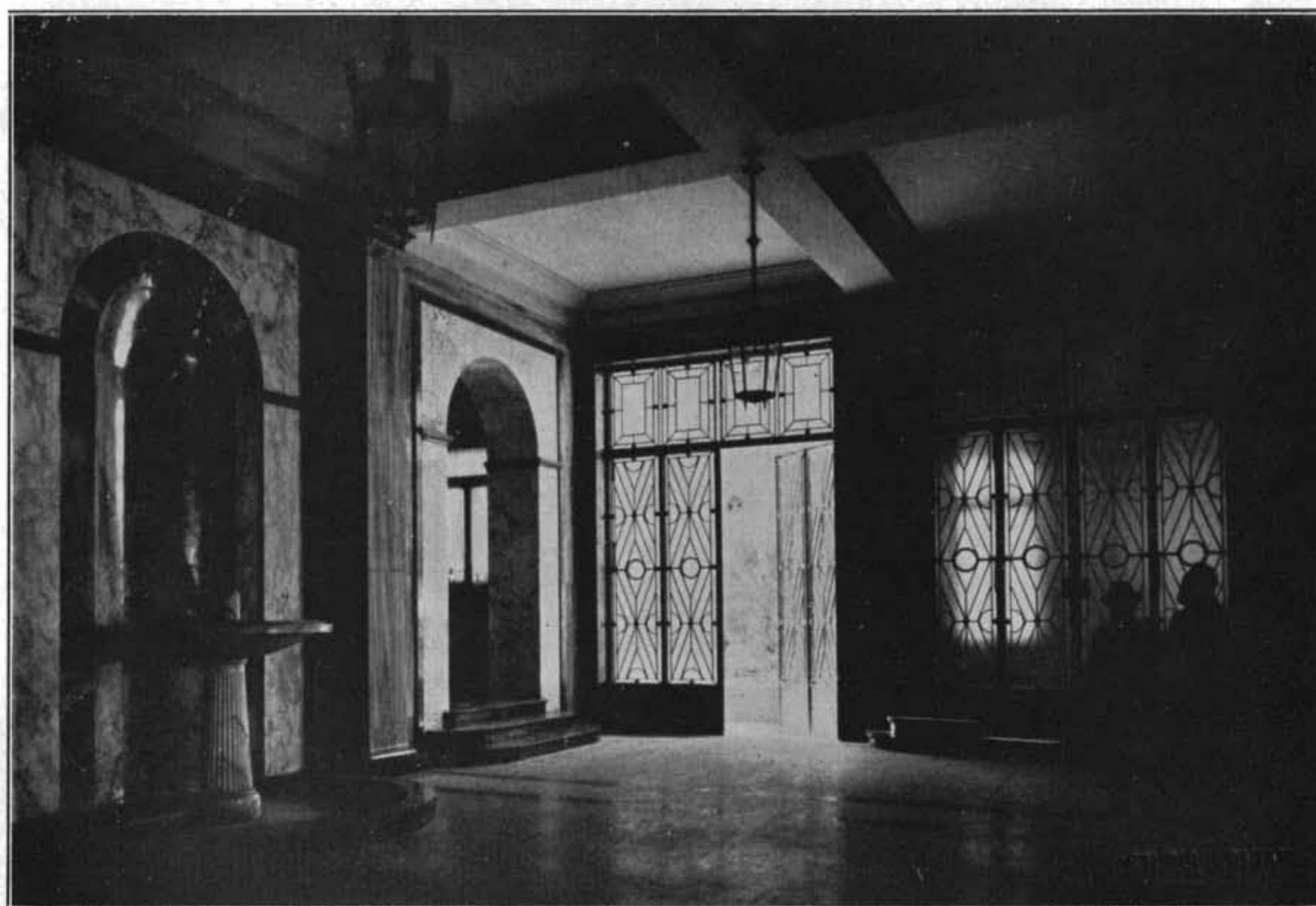
INGRESSO E VESTIBOLO (SOPRA). - VESTIBOLO (SOTTO). ARCH. O. CABIATI E G. FERRAZZA : RESIDENZA DEL GOVERNATORE DELLA CIRENAICA IN BENGASI.