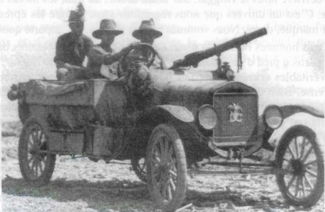
1917 - Ford T armée d'une mitrailleuse Lewis. L'équipage, australien, arbore sur l'écusson du radiateur un palmier