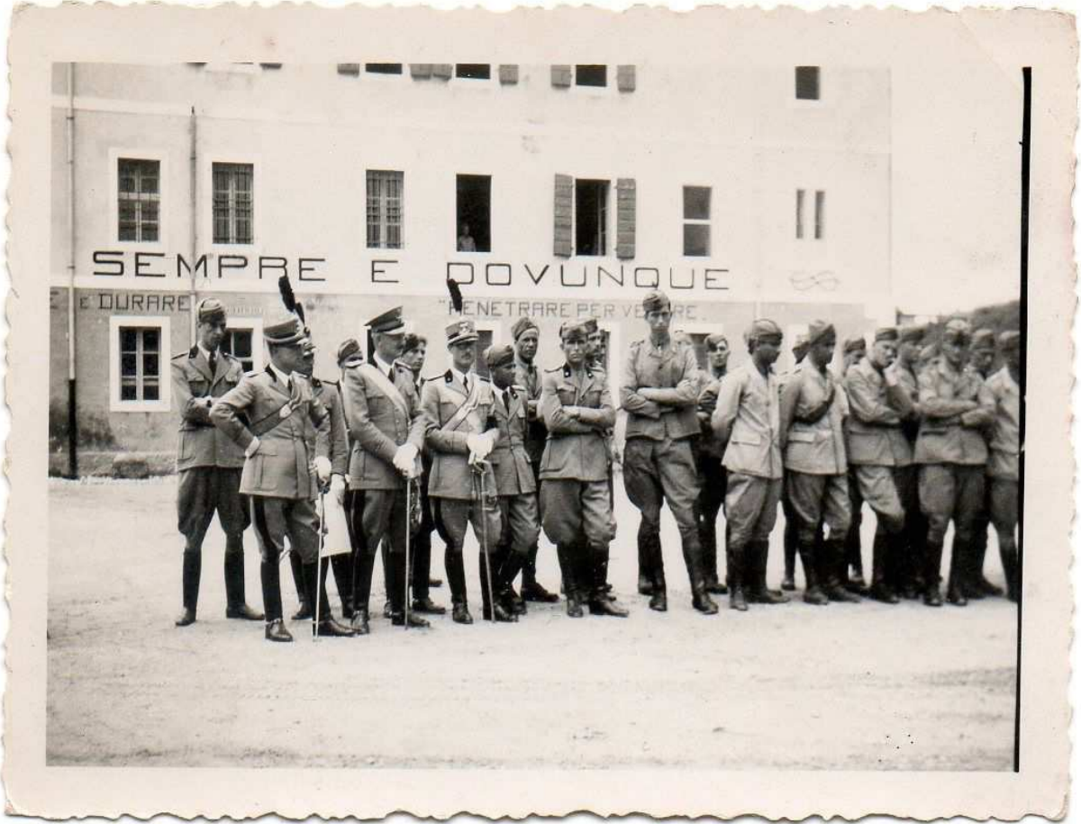
PALMANOVA GIUGNO 1937