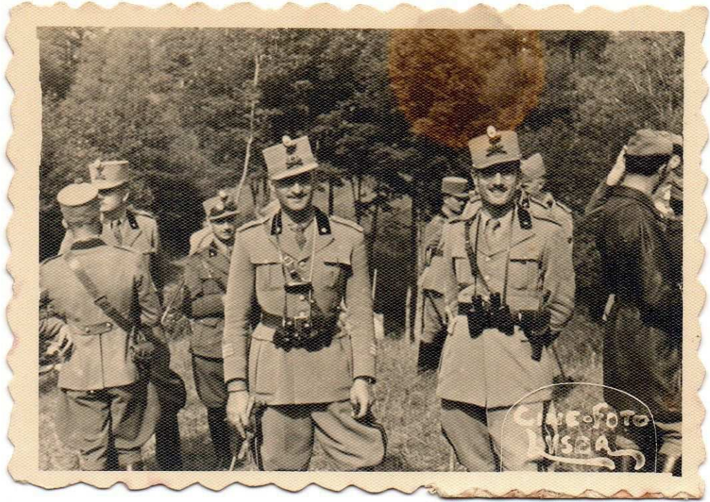
PALMANOVA 20 MAG. 1940"