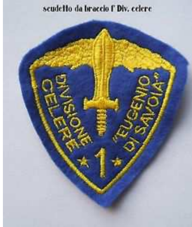
scudello da braccio 1° Div. celere