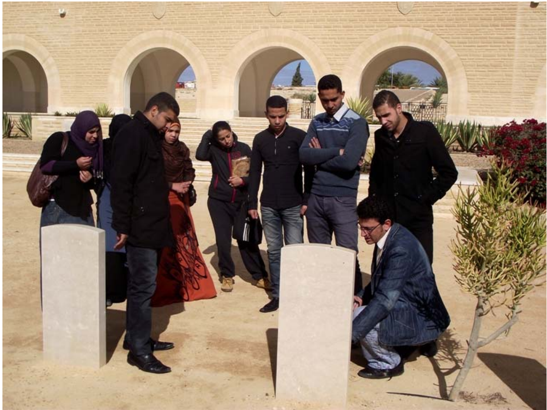
Spiegazione del modo "britannico" di seppellire i caduti, disposizione dei resti, allineamento delle tombe e particolari sulle iscrizioni sulle lapidi