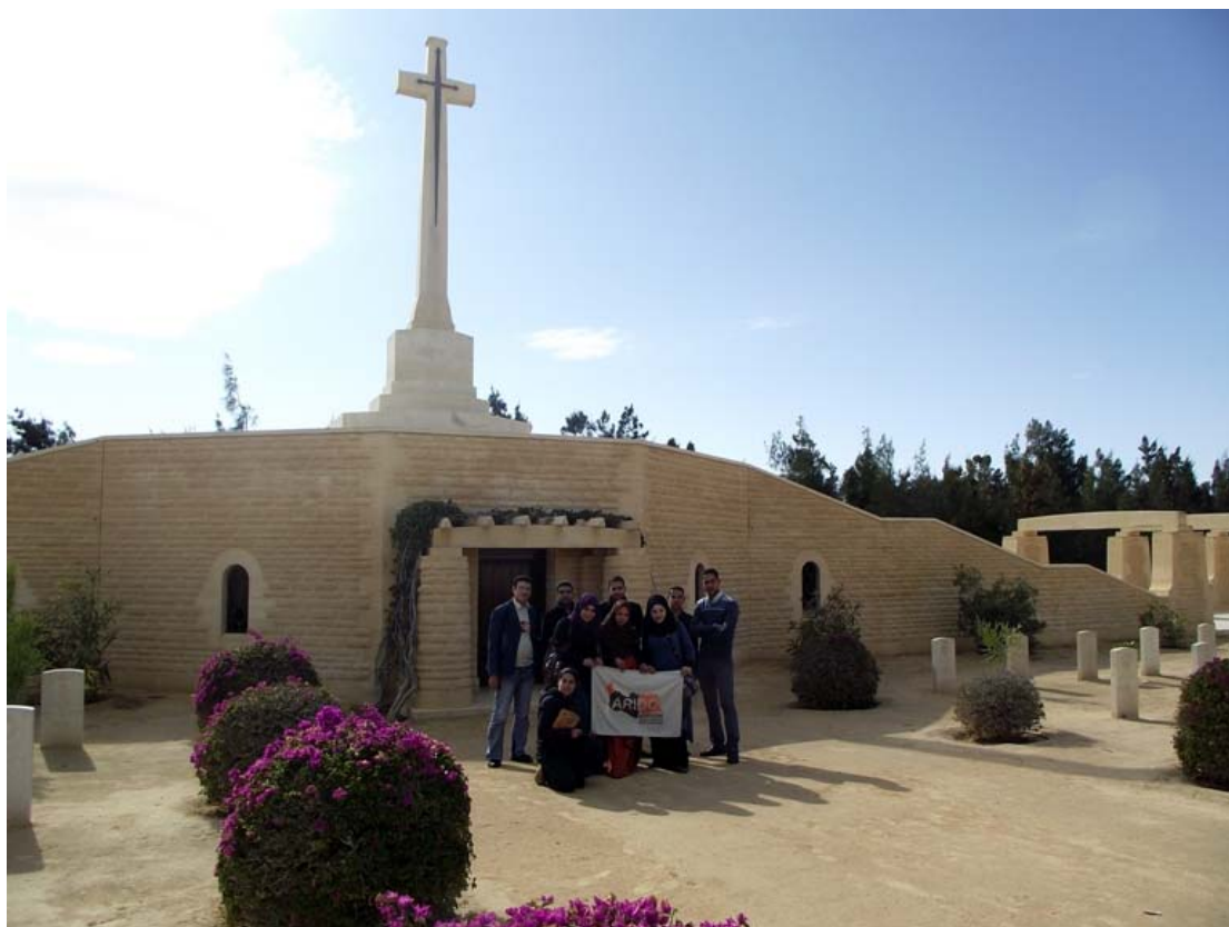
Foto di gruppo sotto the Cross of Sacrifice, presente in ogni cimitero militare britannico purché abbia al suo interno un numero uguale o superiore a 40 sepolture.

La croce fu voluta dal Imperial Graves Commission e fu disegnata da Sir Reginald Blomfield.