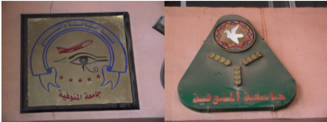
Facolta Turismo ed Alberghiera

Balistica e funzionamento delle armi esposte nel museo annesso al Cimitero Italiano di El Alamein, quel qualcosa in più che non viene certo ne insegnato ne spiegato all' universita.