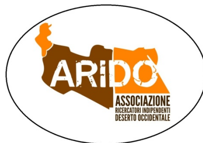
Associazione Ricercatori Indipendenti Deserto Occidentale