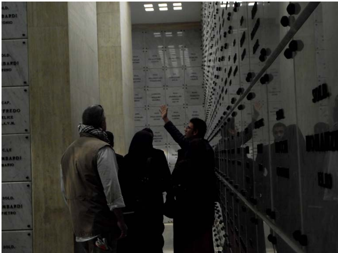
Cimitero Italiano di El Alamein,

la lastra “di riporto” fissata con delle viti alla superficie della lastra originale. Tale scritta, aggiunta in un secondo tempo, fu espressamente richiesta dal console libico in visita al Cimitero Italiano di El Alamein che considero’ disonorevole la dicitura “.....morti per l’Italia” e volle modificarlo in “.....morti in azione”.