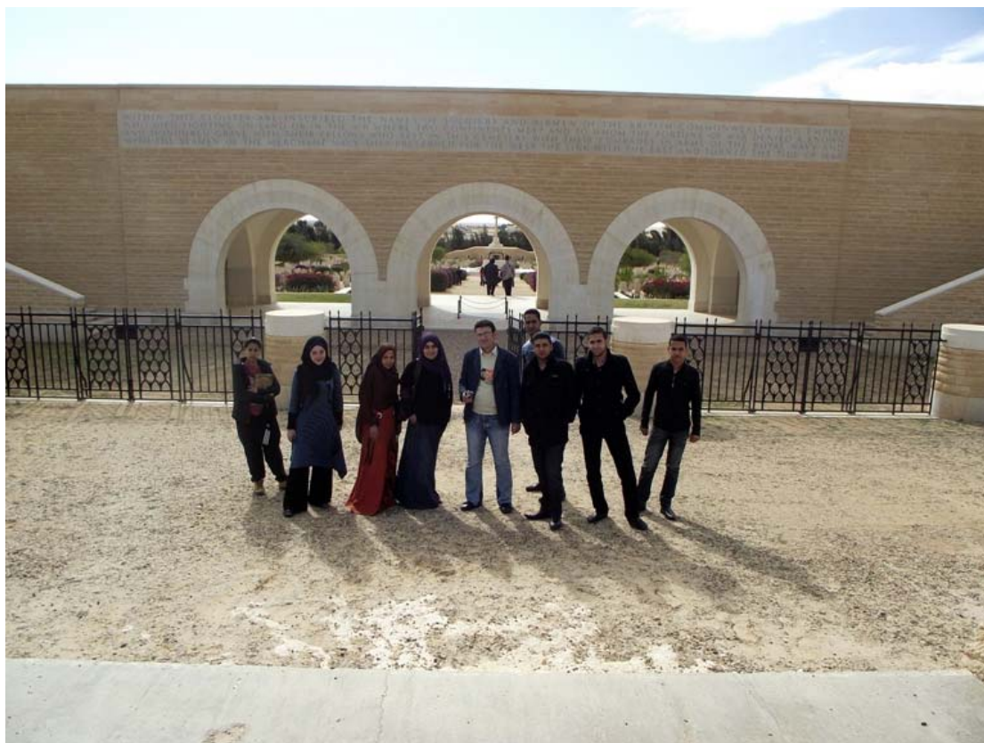
Foto di gruppo all'ingresso del cimitero del Commonwealth