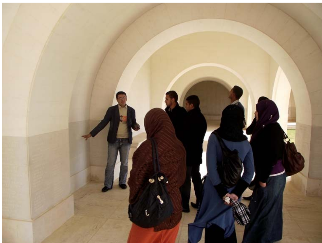
La lezione continua all'interno, subito dopo il porticato di accesso